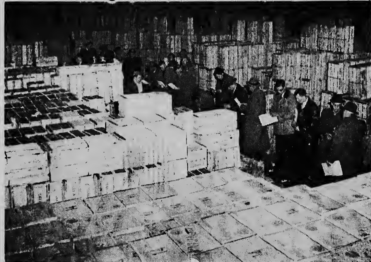
Niet minder dan 125.000 kisten met sinaasappelen, citroenen, grape-fruit en mandarijnen, elk met een inhoud van een dertig kg., stonden eind vorige jaar opgestapeld in de veilinghallen van de Rotterdamse citrus veiling in Rotterdam.